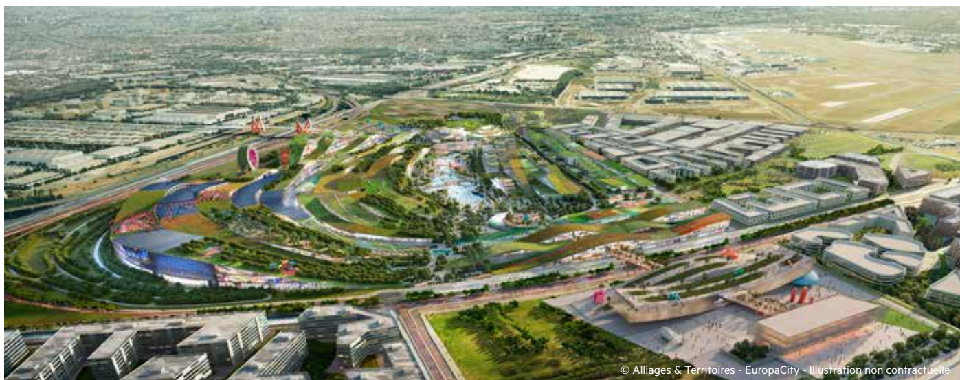
Vue aérienne du projet EuropaCity